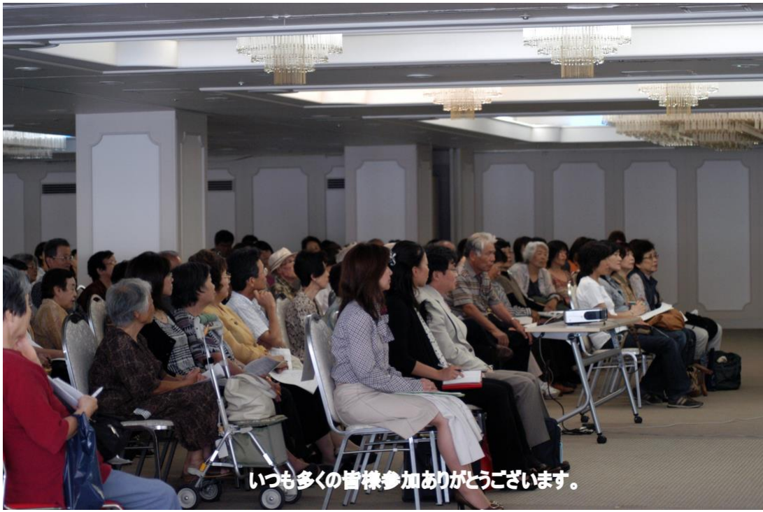
いつも多くの皆様参加ありがとうございます。