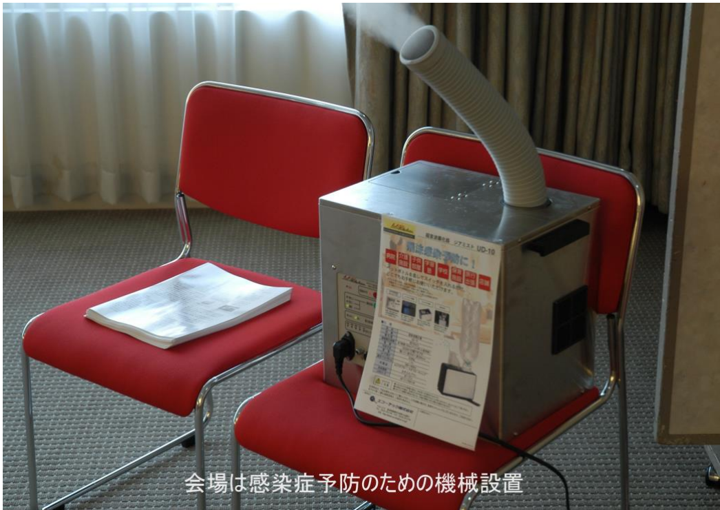
会場は感染症予防のための機械設置